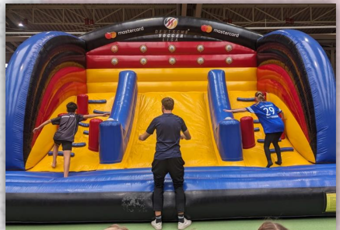
Die "Back to Base" Herausforderung.

Der stimmungsvolle Höhepunkt bildet die 10 x 200m Abschlussstaffel! Sehr aufregend und spannend konnten wir zwischenzeitlich Platz 3 erlaufen und aufgrund übermotivierter Sportlehrer, welche die Wechselzone für die Läufer versperrten, landeten wir hier auf Platz 6 von 10.