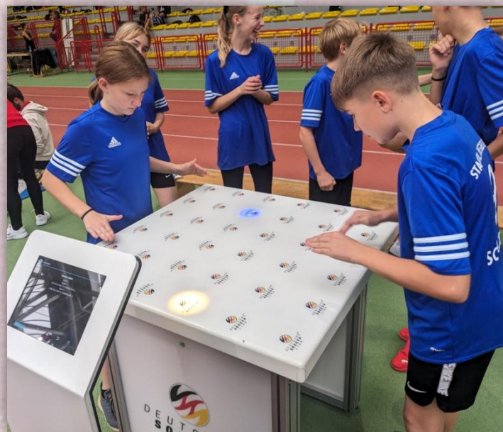
Das T-Wall Reaktionsspiel.

Die kräftezehrendste Station "Back to Base" erwartete uns zum Schluss. In 30 Sekunden mussten die Schüler so schnell wie möglich die Hüpfburg ersprinten und die interaktiven Leuchtpads ausschalten.