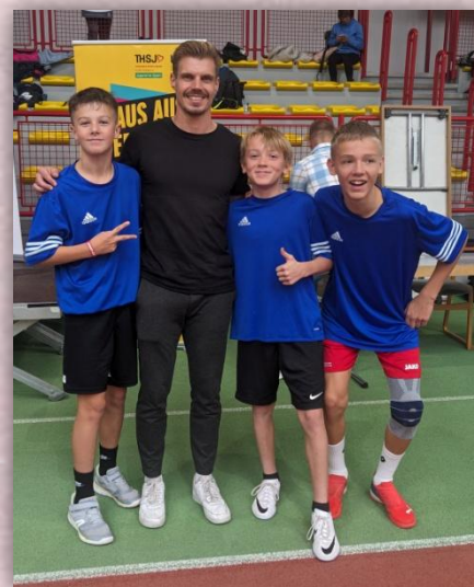
Ein Star zum Anfassen - Julian Reus.