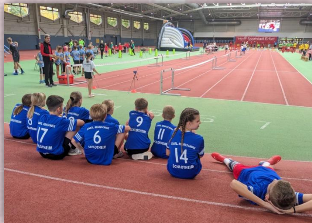
Der 30m Sprint.