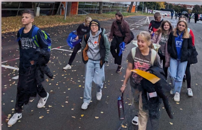
Die Vorfreude steigt.

Ein paar weitere Schnappschüsse von diesem sportlichen Tag: