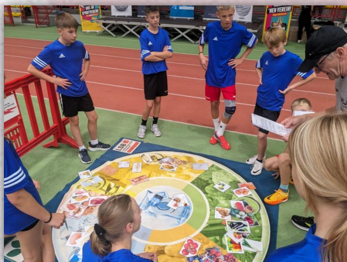
Reaktionsparcour und Gesunde Ernährung.